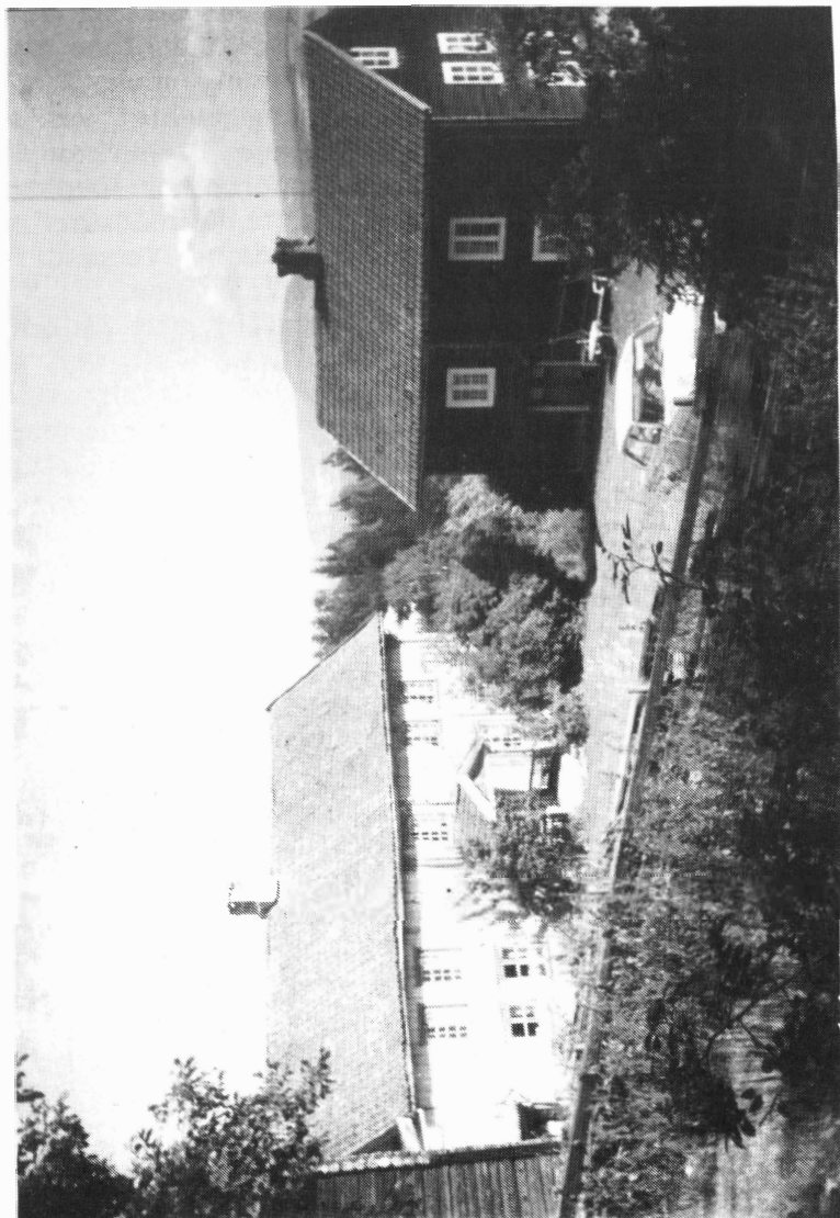
Garden Kammerud i Jevnaker